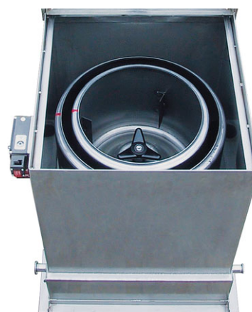
Duplafalú dobszűrő centrifuga DTZ Opció: Rozsdamentes acél kivitel