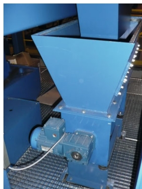
Forgácstartály a forgácsszilippel