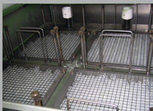
Felvétel a MEDIA-BASKET egy részletéről

Az LFOS rendszerű berendezések „a különböző folyadékok relatív áthatolóképessége a visszatartó testeken” szabálynak megfelelően működnek. A visszatartó testek a „MEDIA BASKET” tartályban vannak elhelyezve és közel korlátlan ideig használhatóak. A visszatartó testek erős szennyezettség esetén kimoshatóak.