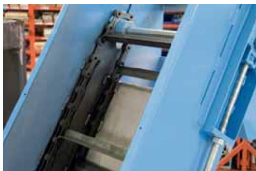
Kaparós szállító, az oldalláncokkal, és a vivoruddal.