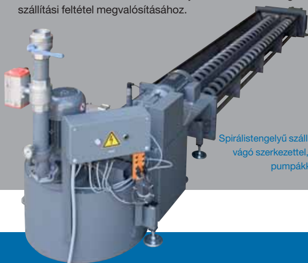
Spirálistengelyű szállító, vágó szerkezettel, és pumpákkal.