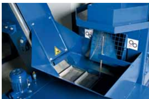
Részletkép a csuklópántos szállítószalagról.